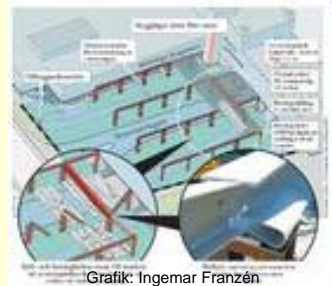
Grafik: Ingemar Franzén